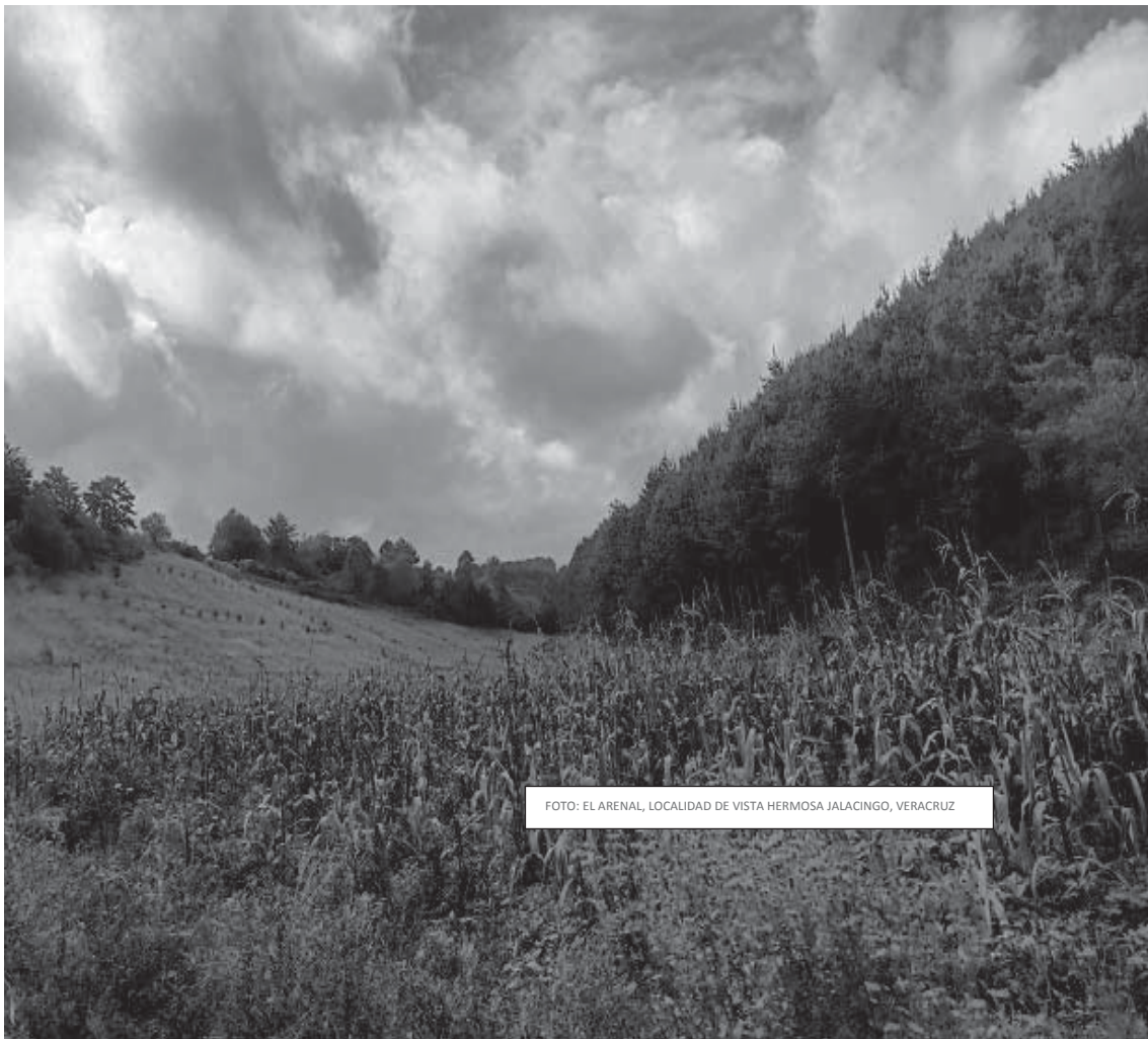
FOTO: EL ARENAL, LOCALIDAD DE VISTA HERMOSA JALACINGO, VERACRUZ

POLÍTICA AMBIENTAL DEL HONORABLE AYUNTAMIENTO DE JALACINGO, VERACRUZ DE IGNACIO DE LA LLAVE.